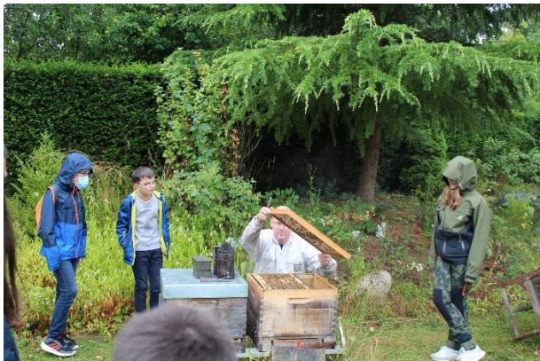
© Stadtbibliothek Hildesheim: Besuch beim Imker