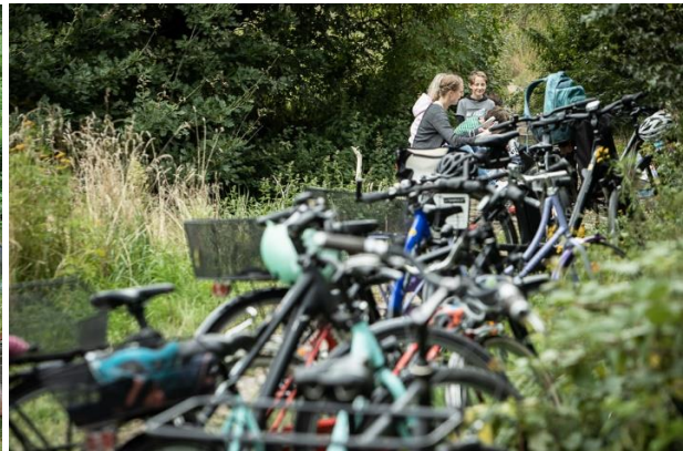
Radtour durch die Natur