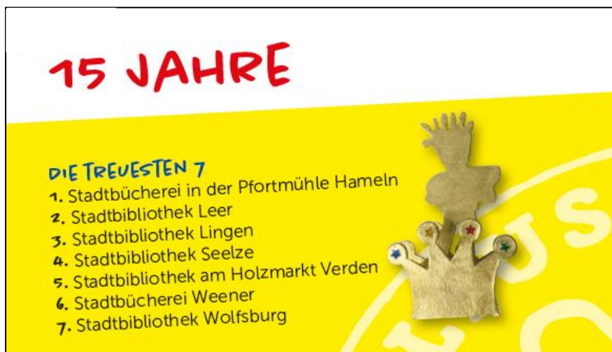
Abbildung 1: Die treuesten 7